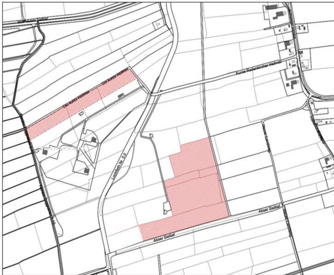
Ergänzungsfläche Freiflächen-Photovoltaikanlage Rodenkircherwarp

Als Erweiterung plant der Vorhabenträger angrenzende Flächen (rd. 10 ha) mit weiteren Modulen zu besetzen: